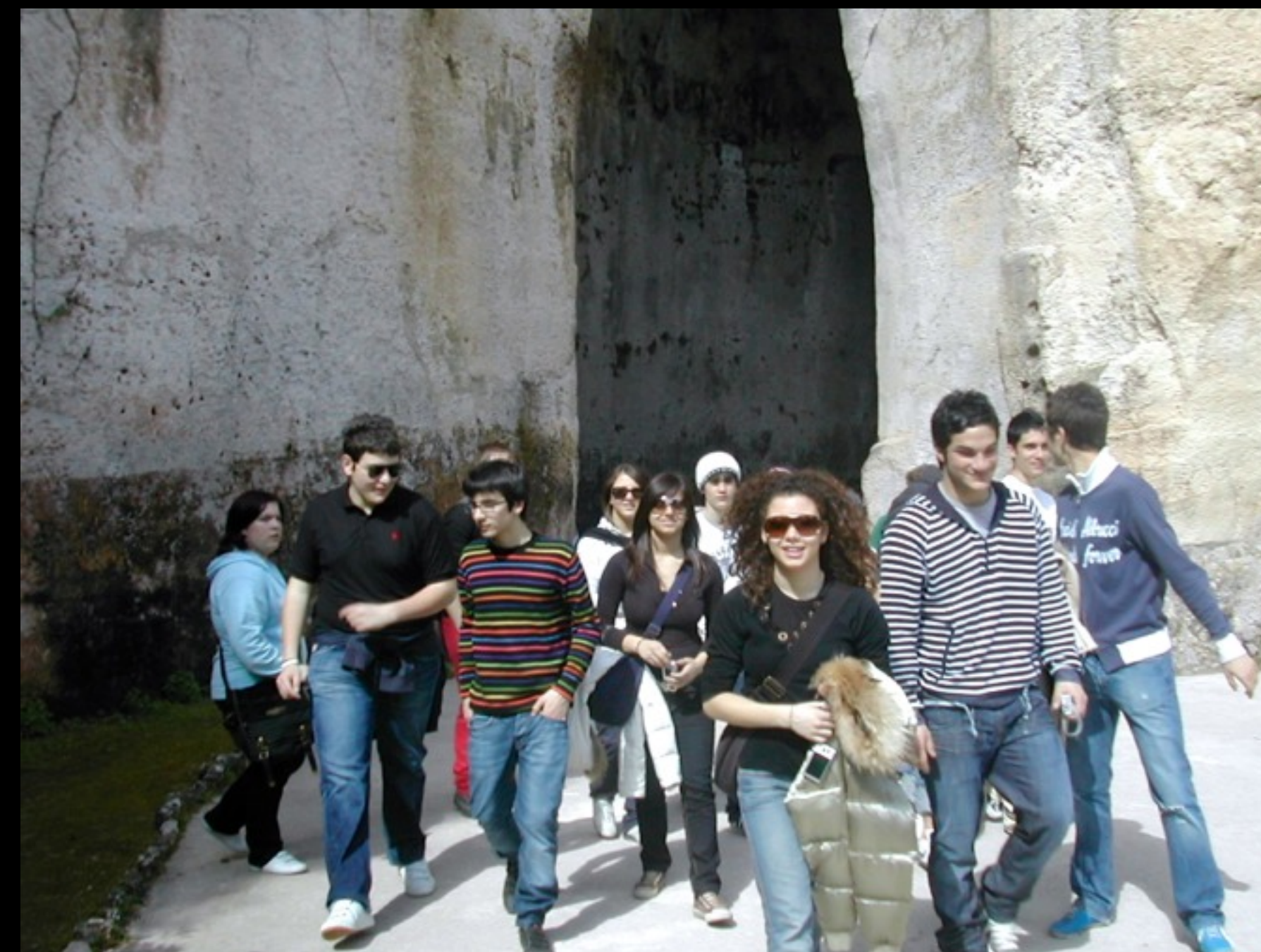
ne escono sollevati