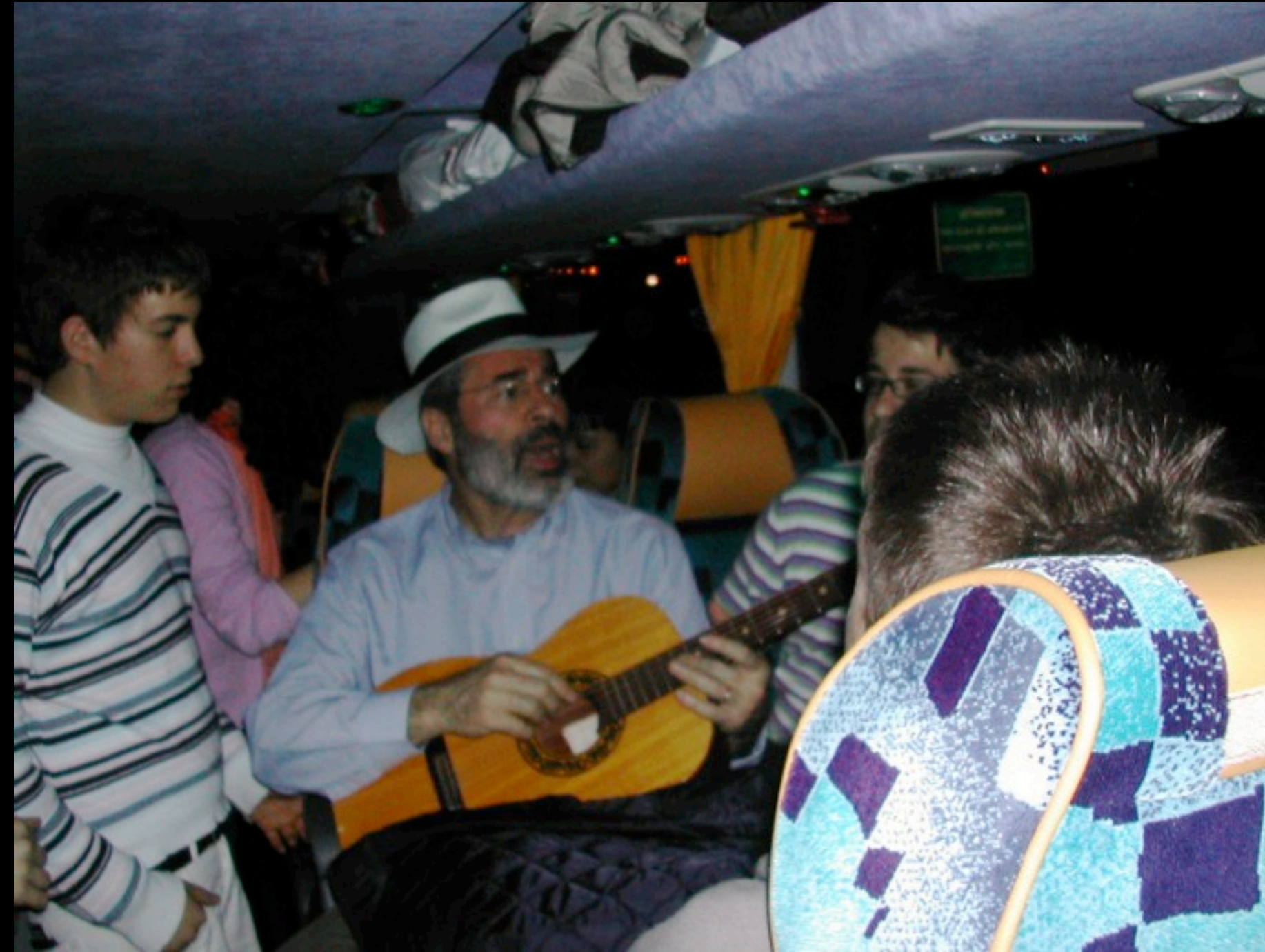
Si finge di saper suonare e cantare