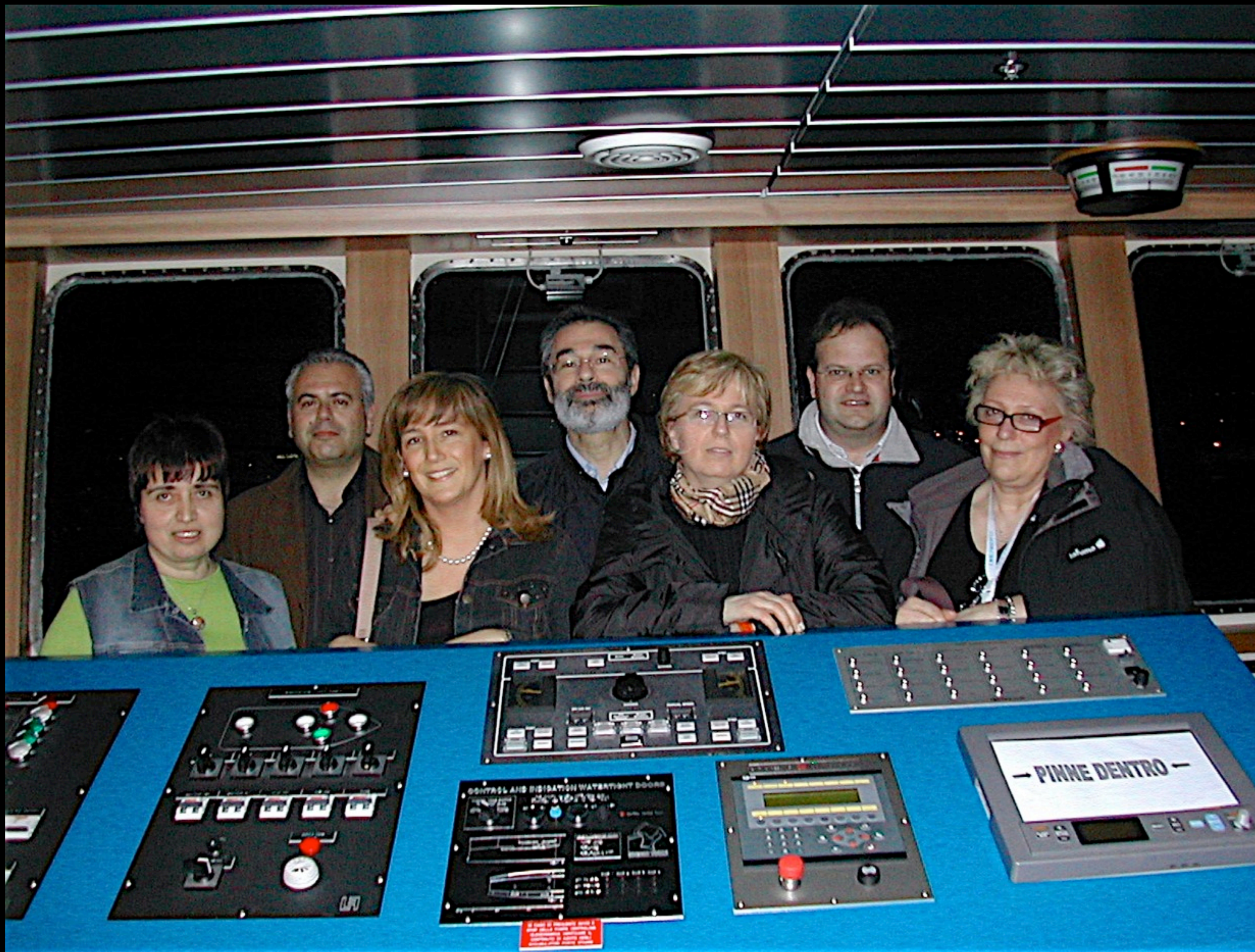
Nella sala di comando del “Caronte”