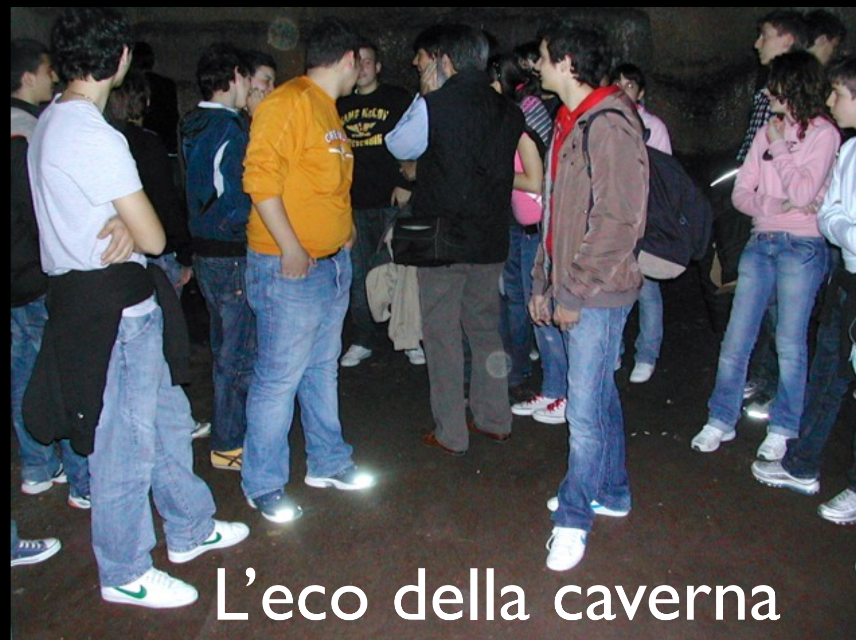
L'eco della caverna