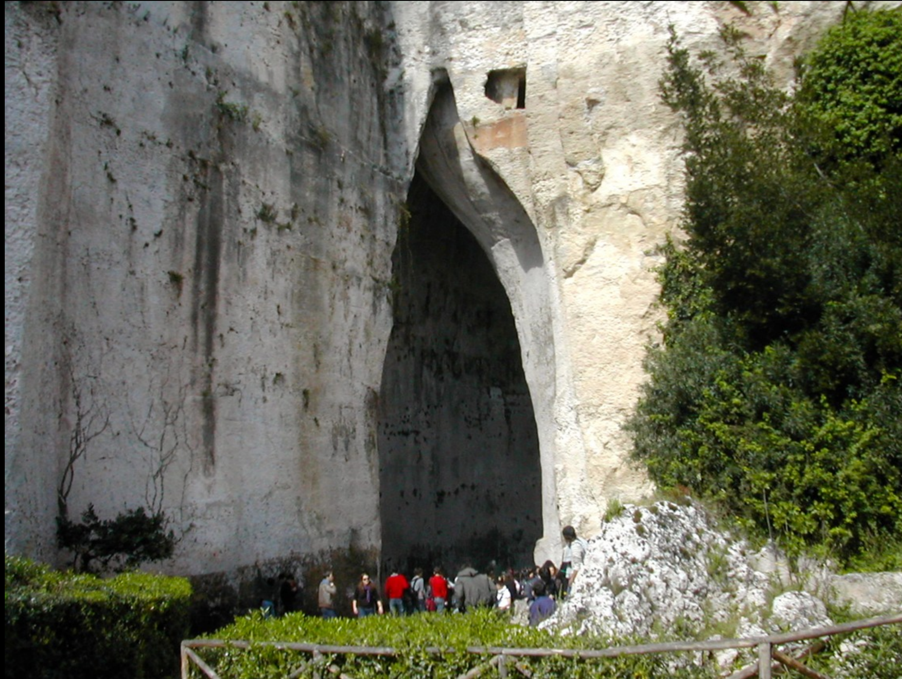
Le latomie e l'orecchio di Dioniso