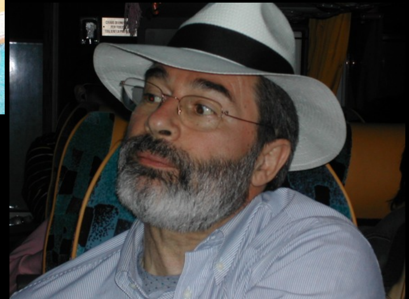
Quante bisogna farne?