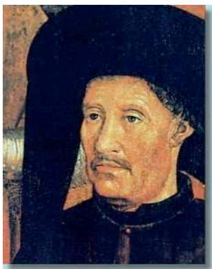
Enrico il Navigatore

Il primo troncone portava da Lisbona fino al Capo di Buona Speranza , lungo le coste dell' Africa orientale. Il secondo attraverso il Mare arabo fino alle città di Goa , Calicut e Cochin nel Malabar sulla costa sud-orientale dell'India.